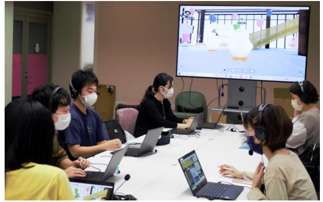
大正大学バーチャルキャンパス内でプレゼンをしながら、チャットで寄せられる疑問・質問に答える学生スタッフ