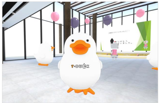
参加者は大学公式キャラクター「T-DUCK」の姿をしたアバターとしてバーチャルキャンパスに参加（入試学生スタッフはロボットのアバターにて登場）