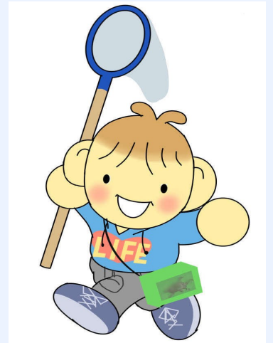
学科キャラクター『らいふみる』くん

総合型選抜入試、高大接続入試の時期が近づいてきました。両入試志願者にとって大切なのは、学科の学びについてよく理解し志望動機を明確にすることです。人間科学科の学びは学融合的なところがあり、ややわかりにくいところもあります。第4号では、学びの集大成でもある卒業論文について紹介します。過去の卒業論文のタイトルをみるだけでも学科の特徴がよく実感できるのではないのでしょうか。また、選択必修科目となっている1年次の重要な3つの授業について紹介しました。心理学、社会学、身体科学の特徴や学び方についてイメージをつかんでいただければと思います。興味がある分野については、紹介した本を手にとっていただき一読していただければ、よりよくそれぞれの分野が理解できることでしょう。