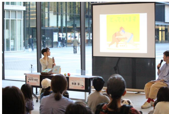
2023年度イベントの様子

当イベントは、豊島区制 90 周年を契機として 2022 年に初開催し、今年で 3 度目の開催となります。